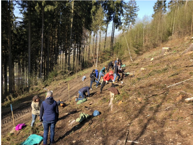
Pflanzaktion in Werdohl

Unsere Kooperation mit dem Bergwaldprojekt