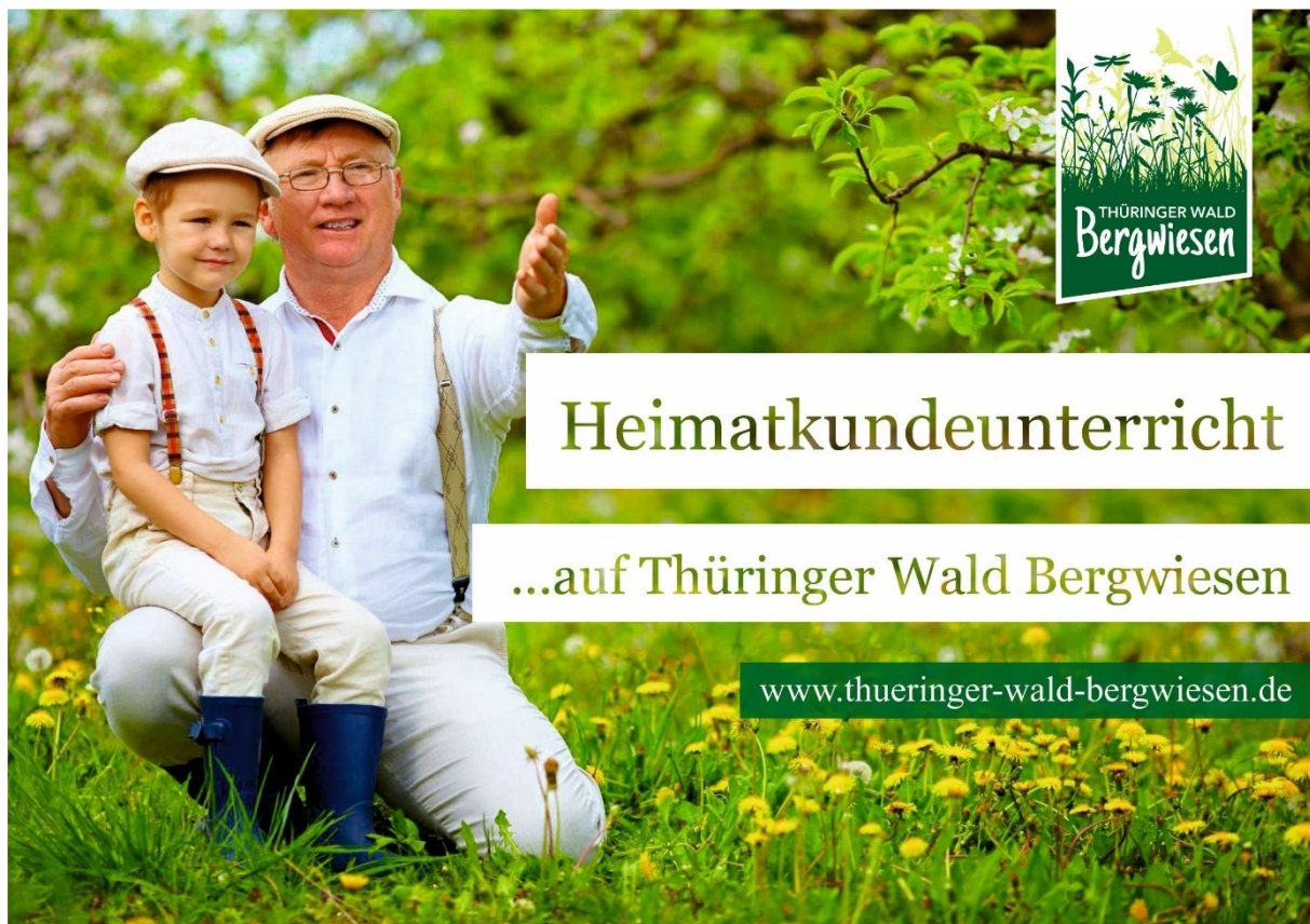
Abb: Entwürfe „Plakatkampagne Emotional“

Bei der Gestaltung und Aussteuerung der besonders auf die Zielgruppe der Einheimischen ausgerichteten Kampagne muss viel Wert auf ein hohes Maß an Emotionalität gelegt werden. Die Platzierung der einzelnen Botschaftsteile unterliegt einem festen Raster, welches sich im „Brandbook“ wiederfindet. Besonders in dieser Zielgruppe wird die kommunikative Ansprache deutlich erfolgreicher sein, wenn die Motive eine emotionale Reaktion auslösen. Der Einsatz von Plakaten für die Kommunikation bietet sich besonders im ländlichen Raum an. Hier muss bei der Ausgestaltung der Motive Wert daraufgelegt werden, dass die Inhalte schnell zu erfassen sind. Bei der Platzierung an viel befahrenen Straßen im Bereich Thüringer Wald sollte zudem Wert auf eine auf die Entfernung bezogene Wiederholung des Plakatmotives gelegt werden. So lassen sich die Inhalte beim Vorbeifahren leichter erfassen.