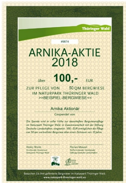
Abb. Arnika-Aktie ( www.foerderstiftung-thueringer-wald.de )

Als Instrument für ein Naturschutz- und Regionalentwicklungengagement können sowohl Privatpersonen als auch Firmen und Institutionen durch den Kauf einer Arnika-Aktie die langfristige Bergwiesenpflege im Naturpark Thüringer Wald unterstützen.