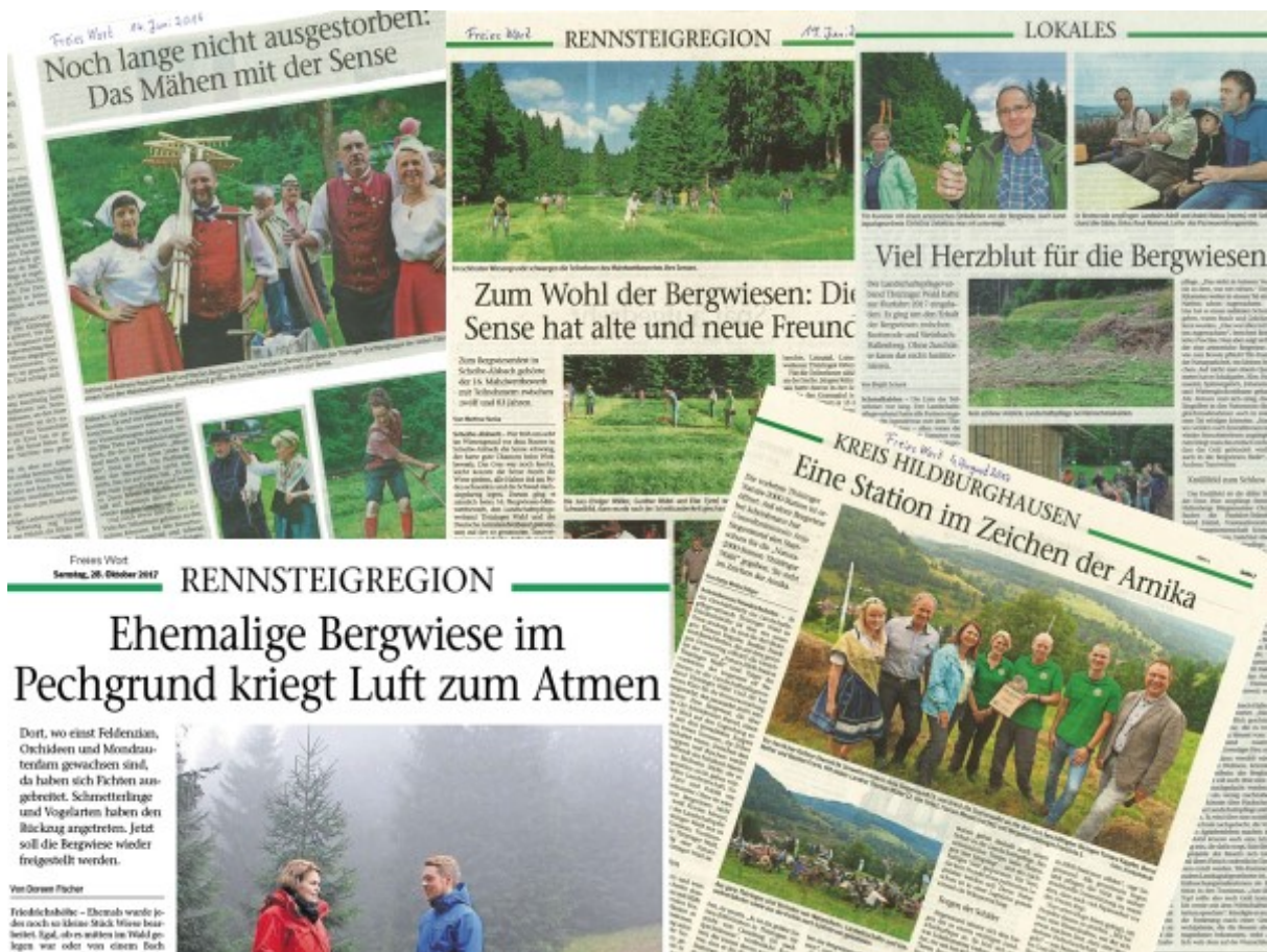
Abb. Beispiele für bereits erfolgreich umgesetzte Pressearbeit

Die professionell gesteuerte Pressearbeit ist eine wesentliche, in allen Maßnahmen flankierende Marketingdisziplin, die ein hohes Maß an Manpower bedarf. Sowohl die breit gestreute Pressemitteilung, als auch die exklusive Story, welche nur mit einem Pressepartner umgesetzt werden soll, muss von der Konzeption bis zur Ermittlung der PR Reichweite betreut werden.