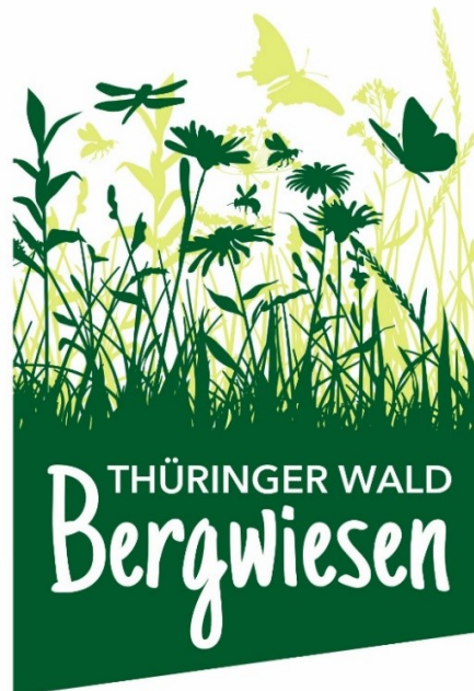
Abb. Logoentwurf (Stand: August 2018), Entwurfsphase

Als Entwurf wurde im Rahmen der Entwicklung der Kommunikationsstrategie ein Logo vorgestellt, welches die Landschaft einer Mittelgebirgsregion andeutet und das Leben auf einer Bergwiese darstellt. Ebenso enthält es den Schriftzug „Thüringer Wald Bergwiesen“. Bei der Farbgestaltung hat man sich hier auf einen natürlichen, grünen Farbraum konzentriert.