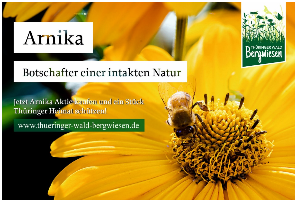
Abb. Plakatentwurf Arnika-Aktie „Jetzt online kaufen und ein Stück Heimat schützen“

Generell kann gesagt werden, dass die Arnika-Aktie im Zusammenspiel der Maßnahmen sowohl inhaltlich und finanziell als auch kommunikativ in der Umsetzung der Strategie eine wesentliche Rolle bei der Erreichung der Ziele spielen wird. Um sich ein Bild zu machen, wie die Arnika-Aktie in Szene gesetzt werden kann, so dient oben dargestelltes Plakatmotiv (Entwurf Phase 1) ohne an dieser Stelle Anspruch auf eine ausreichend ausformulierte „Call to Action“ Darstellung zu legen. Dies erfolgt im Rahmen der Layout Entwicklung und wird durch ein klares Briefing festgeschrieben, welches den rechtlichen Anforderungen und den Maßgaben des OPTIGREEN Projektes entspricht.