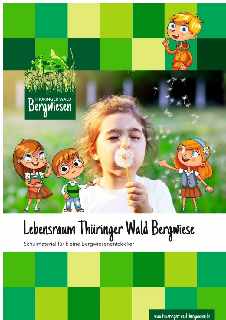
Abb. Entwurf Cover „Lehrmaterial“

Lehrmaterialien sollen professionell aufgearbeitet und altersgerecht (Lehrplan Schuljahr) dargestellt werden. Der Einsatz von modernen Medien ist hierbei ebenso wichtig, wie Lehrhefte, Schülermaterial („Mama, Papa – ich erkläre euch die Bergwiese – Eine kindgerechte Anleitung für den Besuch einer Bergwiese“) und Projekttage auf Thüringer Wald Bergwiesen, Bergwiesenlehrpfade und Filme (z.B. https://www.planet-schule.de/sf/filme-online.php?film=8297 ), die für Unterrichtszwecke eingesetzt werden können.