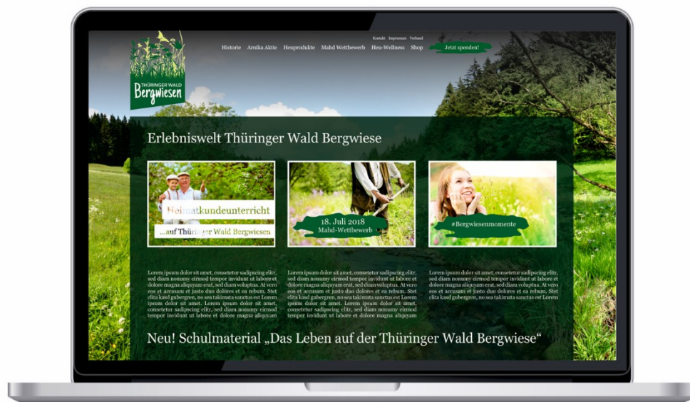
Abb: Entwurf Website

Ein erster Entwurf der Website stellt sich wie folgt dar. Im Rahmen des Markenworkshops sollten die top drei Entwürfe vorgestellt und entschieden werden.