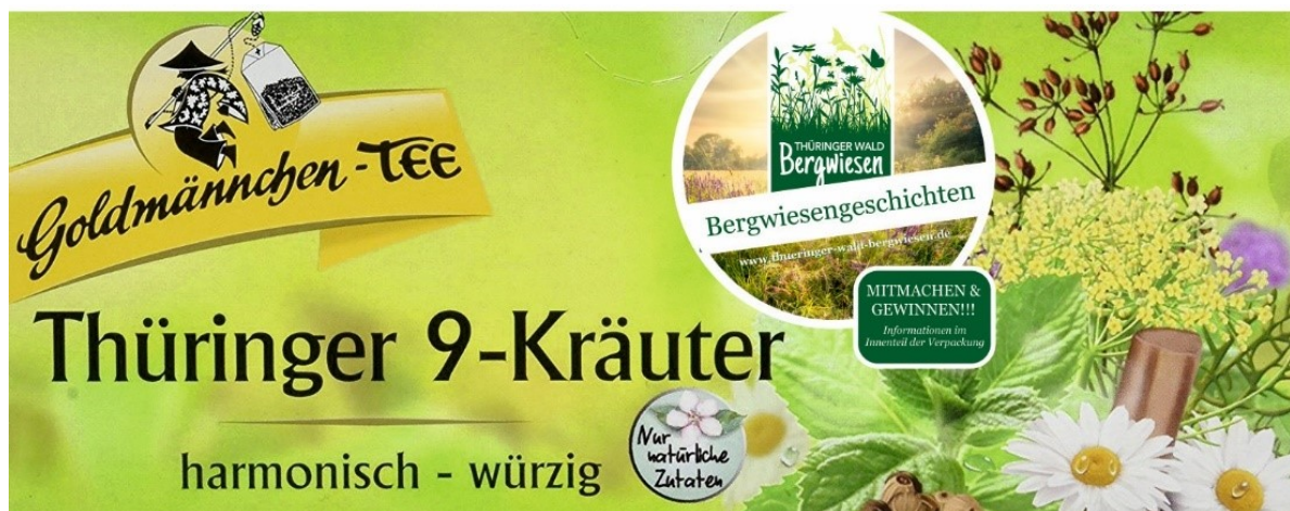
Abb: Grafikidee Störer auf Teeverpackung (Verpackung bis 2018 noch im Handel)

Im Rahmen der Verpackungsgestaltung (außen mit Störer und Aktionsbeschreibung, Hinweis auf Website und Innenseite der Verpackung und bedrucktem Innendeckel des Produktes) kann die Kooperation „Bergwiesengeschichten“ platziert und für Kommunikationszwecke genutzt werden.