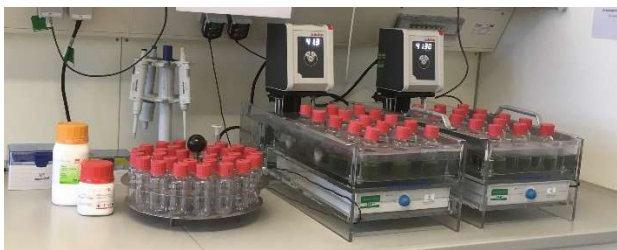
Abbildung 1: Die Bedingungen des Verdauungstraktes des Huhns werden im Reagenzglas simuliert und zur Bestimmung der in vitro Verdaulichkeit genutzt

Es wurde eine etablierte in vitro Multienzym-Methode, die für die Bestimmung der praecaecale Verdaulichkeit des Rohproteins und der Aminosäuren beim Schwein eingesetzt wird, verkürzt und dahingehend angepasst, dass die praecaecale Verdaulichkeit des Rohproteins und der Aminosäuren beim Broiler geschätzt werden kann (Abbildung 1).