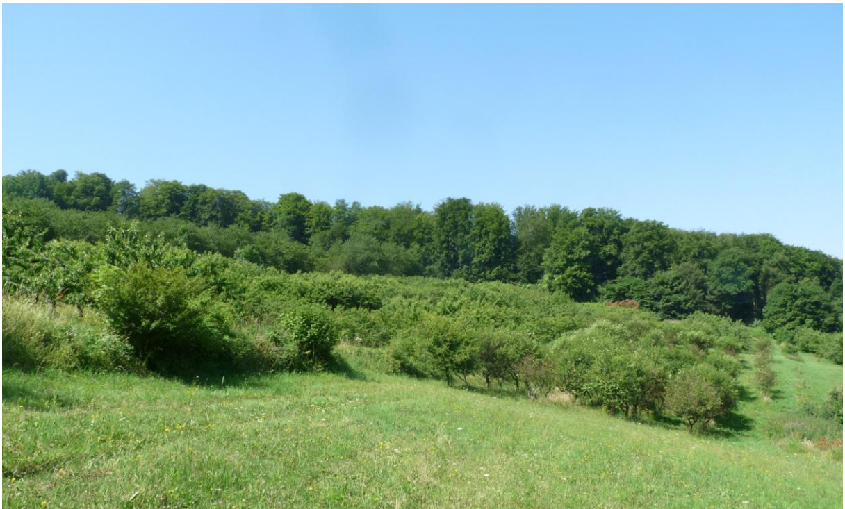
Abb. 9: Versuchsanlagen des DGO-Standortes des LLH in Witzenhausen- Wendershausen