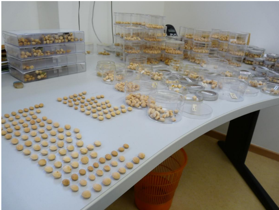
Abb. 3: Probenvergleich mit historischen Fruchtsteinen im Bundessortenamt Marquardt

Nach Ende der Fruchtzeit erfolgte eine weitere vergleichende Überprüfung aller Fruchtsteinproben, auch vergleichende Untersuchungen zwischen Proben der verschiedenen Genbank-Standorte und Untersuchungsjahre unter Hinzuziehung weiterer Referenzen wurden durchgeführt.