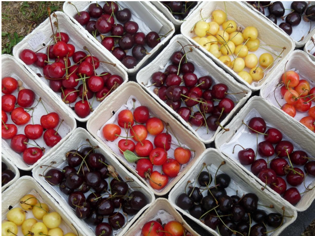
Abb. 1: Sortenvielfalt in den DGO-Sammlungen

Zur Kirschartenbestimmung werden Fruchtform, -farbe, Fleischkonsistenz, Geschmack und Reifezeit verifiziert, wichtiges Bestimmungsmerkmal ist auch die Ausprägung des Fruchtsteines. Zur genauen Methodik der Kirschartenbestimmung s. a. BRAUN-LÜLLEMANN & BANNIER (2010).