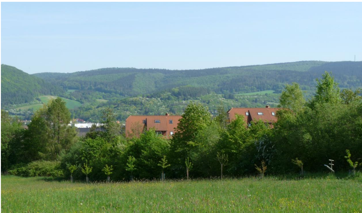
Abb. 8: DGO-Pflanzung entlang des Erlebnispfades in Witzenhausen

Von den 33 Akzessionen (27 Sorten) hatte 16 Bäume (48 %) kein ausreichendes Fruchtmaterial oder waren abgestorben. Dies ist auf die o. g. öffentliche Lage zurückzuführen, die Bäume wurden extra als "Naschbäume" gepflanzt.