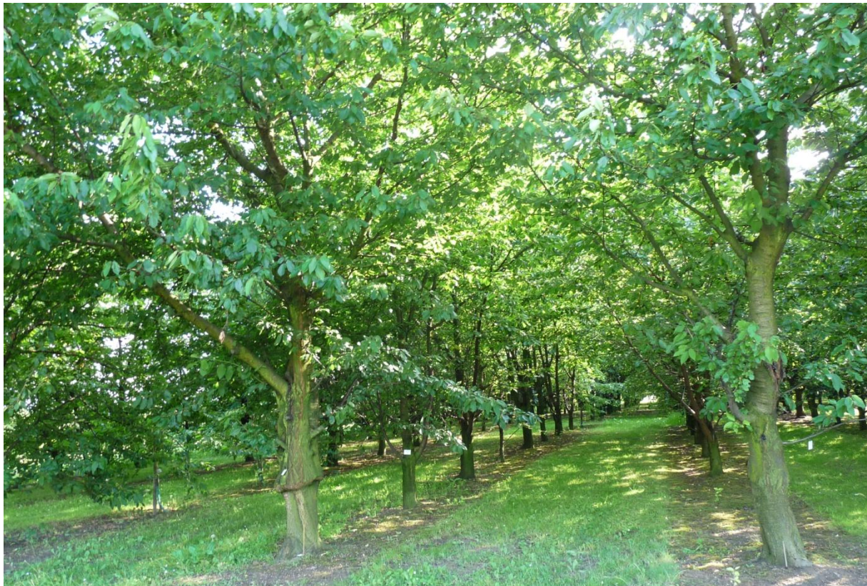
Abb. 4: Ältere Süßkirschenpflanzung des DGO-Standortes des JKI in Dresden-Pillnitz (auf P. avium )

Die Altbäume sind am Standort Pillnitz nicht geschnitten und stehen recht eng. Daher sind sie sehr hoch gewachsen, was die Fruchtprobenname erschwerte. Trotzdem waren i. d. R. genügend Früchte erreichbar, nur in einem Fall hingen die Früchte so hoch, dass sie auch mit einer 4 m langen Teleskopschere nicht beerntbar waren.