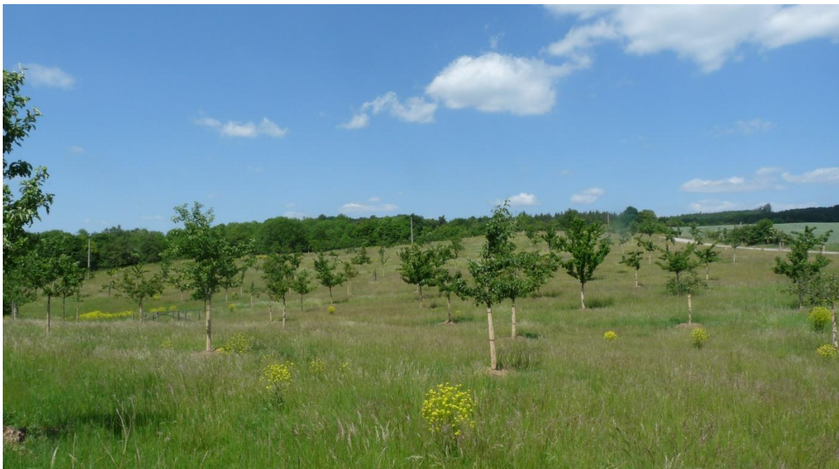
Abb. 6: Hochstammpflanzung des DGO-Standortes Kyffhäuserkreis bei Bad Frankenhausen