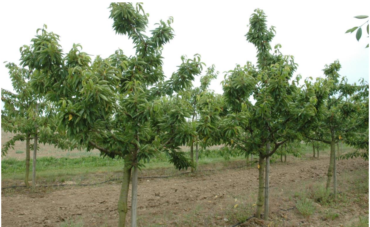
Abb. 4: Süßkirschenanlage des DGO-Standes der LLFG in Ditfurt