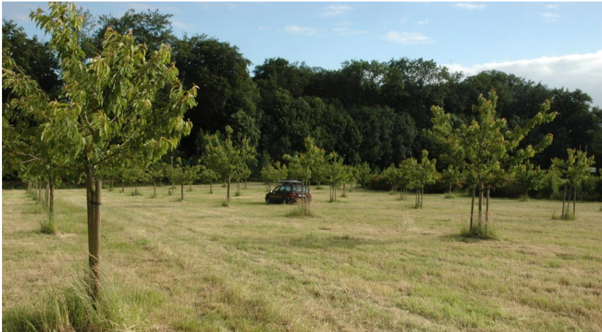
Abb. 7: Hochstammpflanzung des DGO-Standortes Hagen a.T.W. am Jägerberg

Die Pflanzung am Jägerberg in Hagen ist ebenfalls noch relativ jung, es sind Hochstämme aufgepflanzt. Ähnlich wie bei der Kyffhäuserpflanzung ist auch hier das Spektrum der Herkünfte sehr heterogen. Die Kirschpflanzung wurde an diesem Standort in den letzten Jahren ständig erweitert, so dass hier viele Sorten aufgepflanzt sind, die noch nicht an die DGO gemeldet wurden. Diese Jungbäume hatten meist noch keinen Fruchtbehang oder die Probemengen waren so gering bzw. die Merkmalsausprägungen der Erstlingsfrüchte so untypisch, dass keine zuverlässigen Aussagen zur Sortenechtheit möglich sind. Aus diesem Grund hatten in Hagen insgesamt ein Viertel der Bäume bisher noch kein ausreichendes Fruchtmaterial ausgebildet.