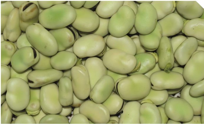
Abb. 1: Ackerbohnsensamen