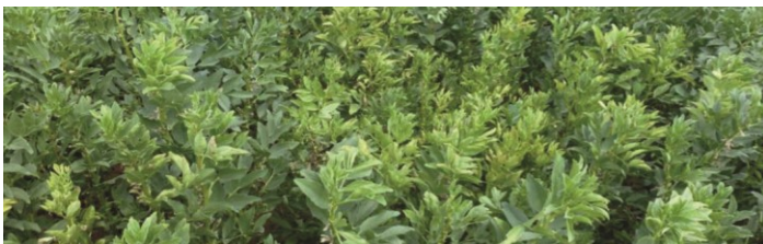
Abb. 4: PNYDV-Infektionsnest in Ackerbohnen, BBCH 75, 07.07.2018

Erste multispektrale Luftbildauswertungen und Vegetationsindex-Berechnungen wie z. B. GNDVI, ließen sich mit Ernteverlusten der beprobten Praxisflächen 2018 zwar schwach, aber signifikant korrelieren. Die Möglichkeiten der Früherkennung von PNYDV-Infektionsherden sind weiter in Erprobung.