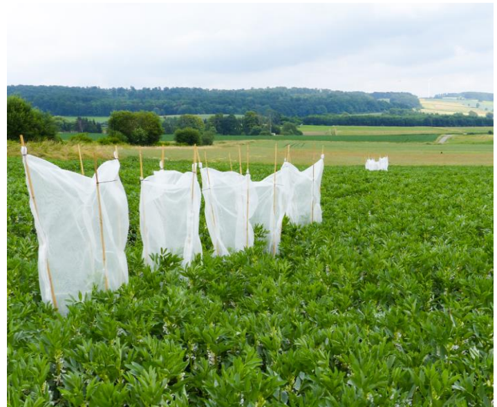
Abb. 3: Bestäubungsversuch: Ausschluss von Bestäubern durch Netze

Die zunehmende Intensivierung der Landwirtschaft bedroht viele Insekten, wie Bestäuber, und damit auch essentielle Ökosystemleistungen. Blühende Leguminosen bieten vielen nektar- und pollensammelnden Insekten, wie Wildbienen, eine ausgezeichnete Nahrungsgrundlage. Die Wirksamkeit des Anbaus von Körnerleguminosen zur Förderung von Bestäubern und Bestäubungsleistungen ist vor allem im konventionellen Anbau unbekannt. Im Einklang mit den Zielen der Eiweißpflanzenstrategie soll das Projekt „RELEVANT“ dazu beitragen, diese Wissenslücken zu schließen.