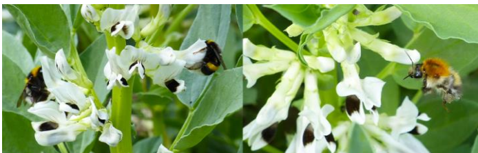
Abb. 5: Hummeln an Ackerbohne

Die Insektenbestäubung ist ein wichtiger Parameter für die Ertragsbildung bei Ackerbohnen und Raps. Insektenbestäubte Pflanzen der Sorte Fuego hatten ein circa 17,6 % höheres Samengewicht pro Pflanze, sowie 57,5 % höhere Erträge (hochgerechnet von Einzelpflanzen) als von Insekten isolierte Pflanzen (Abb. 3). Landschaften mit einem höheren Flächenanteil an naturnahen Lebensräumen und an Ackerbohnen wiesen eine erhöhte Dichte von Hummeln in Ackerbohnenfeldern auf. Außerdem war das Samengewicht pro Pflanze in diesen Landschaften erhöht.