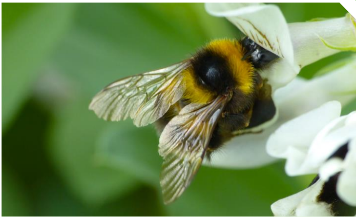
Abb. 1: Gartenhummel an Ackerbohnenblüte