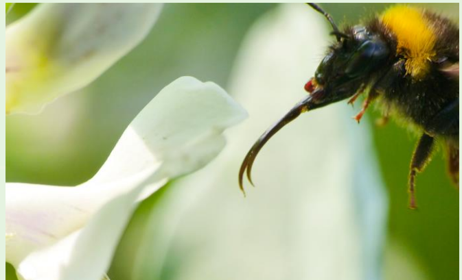
Abb. 2: Langrüsselige Hummel im Anflug auf eine Ackerbohnenblüte