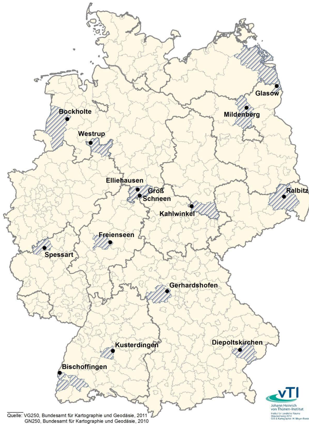
Abbildung 2: Die Lage der Untersuchungsdörfer

Anmerkung: In der Karte namentlich erwähnt sind die ursprünglichen Untersuchungsdörfer. In der Auflage 2012-2014 der Untersuchung ländlicher Lebensverhältnisse im Wandel wurden die Untersuchungsorte teilweise neu gefasst. Dies gilt für folgende Orte: Diepoltskirchen (neu: Gemeinde Falkenberg), Kahlwinkel (neu: Gemeinde Finne-land), Mildenberg (neu: Zehdenicker Ortsteile), Ralbitz (neu: Gemeinde Ralbitz-Rosenthal), Glasow (neu: Gemeinden Glasow und Krackow).