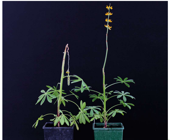
Abb. 2: Anthraknoseresistenztest Gewächshaus: links anfällig, rechts resistent

Die Gelbe und die Weiße Lupine sind interessante Eiweißpflanzen. Grund dafür sind ihre hohen Proteingehalte und ihr positiver Einfluss auf das Ökosystem. Allerdings sind beide Fruchtarten sehr anfällig für die Brennfleckenkrankheit Anthraknose. Im Vergleich zur konventionellen Landwirtschaft dürfen im Öko-Landbau keine Beizmittel gegen Anthraknose eingesetzt werden. Eine Verbesserung der Resistenz gegen diese Krankheit bietet für die Öko-Landwirtschaft daher neue Chancen beim Anbau heimischer Eiweißpflanzen. Da auch der Einsatz von Sikkationsmitteln im Öko-Landbau nicht möglich ist, war die Frühreife ein Kriterium. Außerdem wurden im Versuch weitere Inhaltsstoffe berücksichtigt. Je nach Protein- und Bitterstoffgehalt konnte die Anbauwürdigkeit bei verschiedenen Umweltbedingungen beurteilt werden.