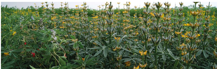
Abb. 3: Anthraknoseversuch Freiland: links anfällig, rechts resistent

Die Versuchsergebnisse unterstützen die Eiweißpflanzenstrategie des BMEL.