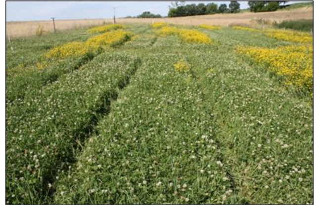
Ökologisches Versuchsfeld vor dem 2. Schnitt 2015

Beide Befunde weisen auf die realistische Möglichkeit hin, unter hiesigen Bedingungen eine moderate P-Düngung zur Förderung der Grünlandleguminosen ohne markant negative Auswirkungen auf die Phytodiversität zu rechtfertigen und damit auch zu praktizieren.