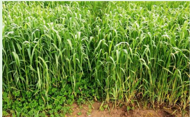
Abb. 2: Versuchspartellen mit u. ohne Begleitkultur (Weizen u. Erdklee)

Erdklee ist relativ winterfest und eignet sich gut als Begleitkultur für Wintergetreide. Außerdem unterdrücken dichte Bestände Unkräuter wirksam.