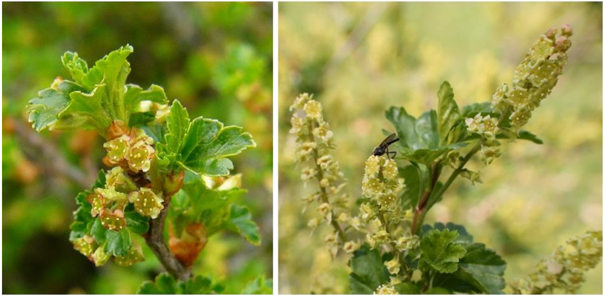
Weibliche (linkes Bild) und männliche Blüten (rechtes Bild) bei der Alpen-Johannisbeere (Ribes alpinum)