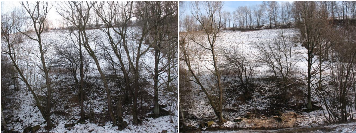
Stark überschilderte Wildapfelbäume vor und nach der Freistellung. Durch die Entnahme von fünf Bedrängern sind die seltenen Wildobstgehölze wieder ideal besont.

Eine Nachpflege der Standorte ist zu gewährleisten, insbesondere bei der Entnahme stockausschlagsfreudiger Gehölze (Pappel, Ahorn) oder dem Rückschnitt starkwüchsiger Sträucher (insbesondere Schlehe, Wildrosen).